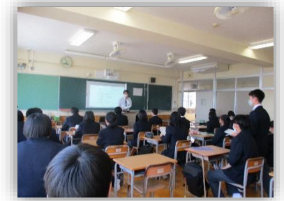
初めてのホームルーム