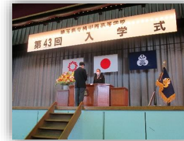
入学式《誓いの言葉》