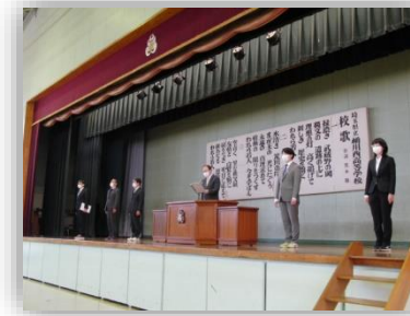
始業式《新転任者紹介》

4月8日、体育館にて令和4年度1学期始業式が行われ、新年度がスタートしました。また、午後からは第43回入学式が執り行われました。式では新入生134名が校長先生より入学許可を受け、桶西生としての第一歩を踏み出しました。